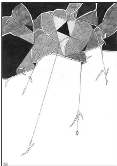
Andělská křídla XXVII, 2007, kvaš, tuš